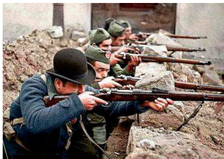
La defensa de Madrid fue encarnizada.

Y la última foto, los internados en el campo de Argelès-sur-Mer. Una multitud interminable de hombres, muchos de ellos con uniforme militar. Erguidos, desafiantes, indómitos, los puños al viento como hombres que se niegan a aceptar la derrota. Y sea lo que sea lo que pensemos, la España con la que nos identifiquemos si es que nos identificamos con alguna, no podemos evitar un sentimiento de orgullo y de respeto porque son los padres de nuestros abuelos quienes nos miran, quienes nos interpellan, quienes tal vez nos piden comprensión. Resuenan al tiempo las palabras de Azaña como si acabaran de ser pronunciadas: Paz, piedad y perdón.