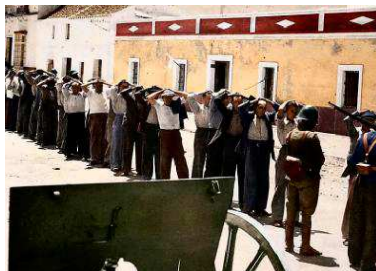
Detenidos republicanos en Utrera, en julio de 1936.