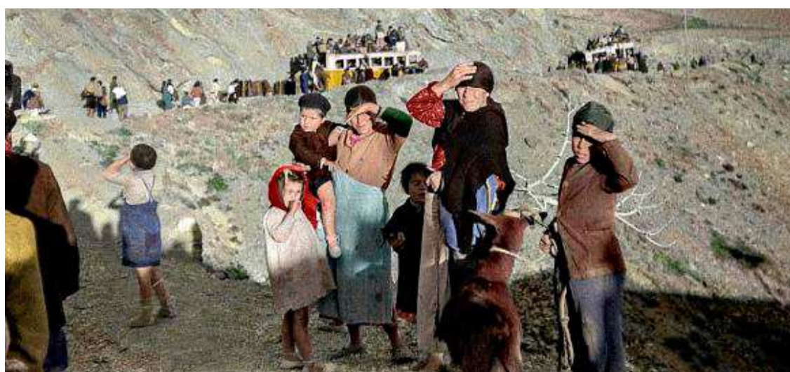
La 'desbandá' tras la caída de Málaga en febrero de 1937.